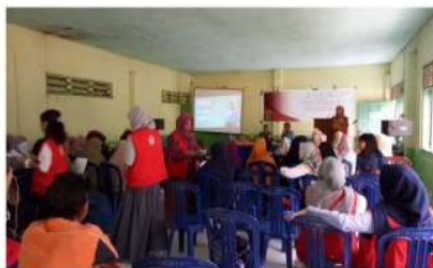
Gambar 2. Pelaksanaan pelatihan kader dusun

Materi yang diberikan pada pelatihan ini adalah tentang SM dan cara untuk melakukan skrining SM di Masyarakat. Peserta pelatihan ini adalah sebanyak 37 orang. Berdasarkan hasil kuesioner, ditemukan bahwa sebelum pelatihan terdapat 18,9% responden yang memiliki pengetahuan baik. Setelah pelatihan, pengetahuan responden dalam skala baik meningkat sebesar 43,2% menjadi 62,1%. Untuk pengetahuan cukup, sebelum pelatihan ditemukan terdapat 45,9%. Dan setelah pelatihan, menurun sebesar 13,5% menjadi 32,4%. Untuk pengetahuan kurang, sebelum pelatihan terdapat 35,2%. Setelah pelatihan mengalami penurunan sebesar 29,7% menjadi 5,4%