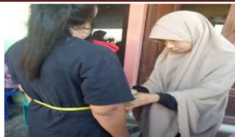
Gambar 4. Pendampingan saat kader mengukur lingkar perut

Pada kegiatan pendampingan, setelah dilakukan observasi terlihat bahwa kader yang dilatih cukup terampil dalam melakukan skrening SM. Para kader tersebut dapat melakukan pengukuran antropometri maupun tekanan darah. Kegiatan pendampingan memang sering digunakan untuk mencapai perbaikan tertentu. Baik pada bidang kesehatan maupun bidang lain, misalnya pariwisata. Pada bidang kesehatan, kegiatan pendampingan kader kesehatan dalam strategi produksi dan promosi MP-ASI mampu meningkatkan pengetahuan dan minat kader kesehatan dalam produksi dan pemasaran MP ASI yang sehat (Purwati dkk., 2018).