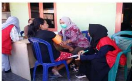
Gambar 3. Pendampingan saat kader mengukur tekanan darah

Setelah dilakukan pelatihan, kader dusun kemudian didampingi oleh mahasiswa untuk melakukan skrening SM di masyarakat. Skrening dilakukan dengan melihat faktor risiko kemudian dilanjutkan dengan pengukuran antropometri. Pengukuran antropometri yang dilakukan terdiri dari penimbangan berat badan dan pengukuran tinggi badan, lingkar perut dan tekanan darah. Berdasarkan hasil observasi yang dilakukan, terlihat bahwa kader dusun telah mampu melakukan skrening SM di Masyarakat sesuai dengan hasil pelatihan yang telah didapatkan.