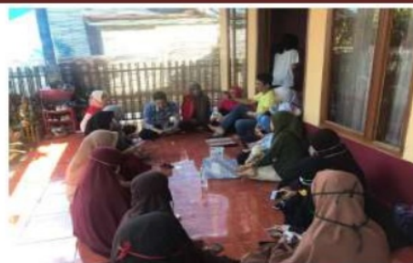
Gambar 1. Persiapan pelaksanaan pelatihan kader dusun

Sebelum dilaksanakan pelatihan kader dusun, tim pelaksana kegiatan pengabdian kepada masyarakat melakukan serangkaian persiapan, seperti upaya untuk menjaring kader calon peserta pelatihan, mengurus perizinan serta menyusun materi pelatihan. Pelatihan kader dusun sendiri dilakukan di aula Desa Pa'lalakang pada tanggal 29 Juni 2019